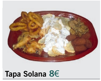
Tapas Solana 8€